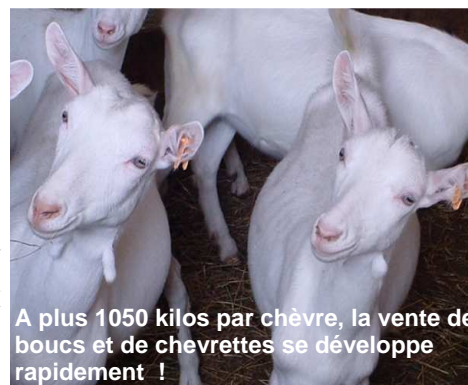
A plus 1050 kilos par chèvre, la vente de boucs et de chevrettes se développe rapidement !

Au bilan, nous avons gagné sur tous les tableaux. Pour un investissement de moins de 55 € par chèvre, j'ai gagné en efficacité dans le travail.